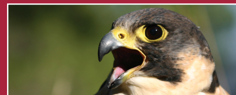
Halcón peregrino ( Falco peregrinus ). Josep Gener.

Sant Joan del Codolar [5.1]: (750 m) Lugar eremítico de la sierra de Montsant, donde, desde la época medieval, se han establecido personas dedicadas a la oración y la meditación, que querían aislarse del mundo exterior. Al lado del pequeño cobijo usado como eremitorio, los cartujos erigieron una ermita hacia el año 1499. Ermita de Sant Joan Petit: Pequeña capilla situada en el camino de acceso. Paso de Montsant [5.2]: Antiguo camino de herradura, muy frecuentado por las gentes de Cornudella. Fuente del Manyano [5.6]: Escondida entre bojés, se ha aprovechado como abrevadero para el ganado. Aún se conserva una gamella de madera. Grau Gran [5.7]: Actualmente por aquí pasa una pista que ha hecho desaparecer el antiguo camino de herradura que subía a la Serra Major y que iba de Albarca a Cabacés. Camino de La Llisera [5.8]: Sendero que discurre por encima de un estrato de roca.