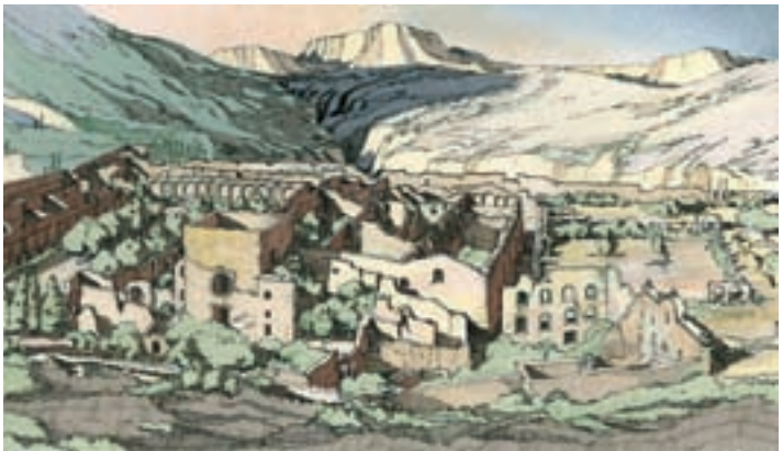
Image de la Chartreuse d'Escaladei, montrant son état après l'assaut anticlérical de 1835.