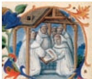
Miniature de saint Bruno avec ses compagnons dans la chartreuse, extraite du livre Les très riches heures du duc de Berry .

LE PARCOURS COMMENCE À L'EXTÉRIEUR DE LA CHARTREUSE. VOUS DEVEZ EMPRUNTER LE CHEMIN AGRICOLE QUI PART SUR LA GAUCHE DU MONUMENT.