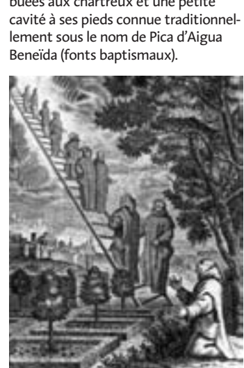
Gravure du XVIIIe siècle recueillant la légende de la vision du roi Alphonse le Chaste qui donna lieu à la fondation d'Escaladei.

Au-dessus des ruines de la chartreuse apparaissent et nous entourent les parois de conglomérat qui captivèrent indéniablement les chartreux et qui continuent à séduire de nos jours les promeneurs. En arrivant au col, vous pourrez contempler l'étendue des falaises qui vont sur la gauche vers Vilella Alta. L'échelle de Dieu (Scala Dei) qui conduisait les anges au ciel est facile à imaginer dans ce site. Tout permet de penser que le rêve que le berger raconta aux envoyés du roi qui cherchaient un endroit où situer la chartreuse prend ses origines dans les degrés qui permettent de franchir le dénivellement des escarpements. En pleine falaise et près d'ici se trouve le « Grau de l'Escltxa » qui présente des marches taillées dans la roche attribuées aux chartreux et une petite cavité à ses pieds connue traditionnellement sous le nom de Pica d'Aigua Beneïda (fonts baptismaux).