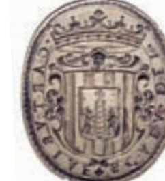
Sceau de la chartreuse d'Escaladei. Début du XVIIIe siècle.