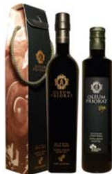
Oleum Priorat Elixir Oleum Priorat Vitae