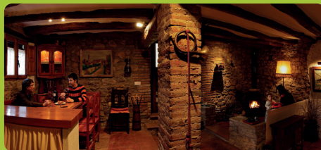
Gîte rural L'Era

..... Pour plus d'informations et réserver: