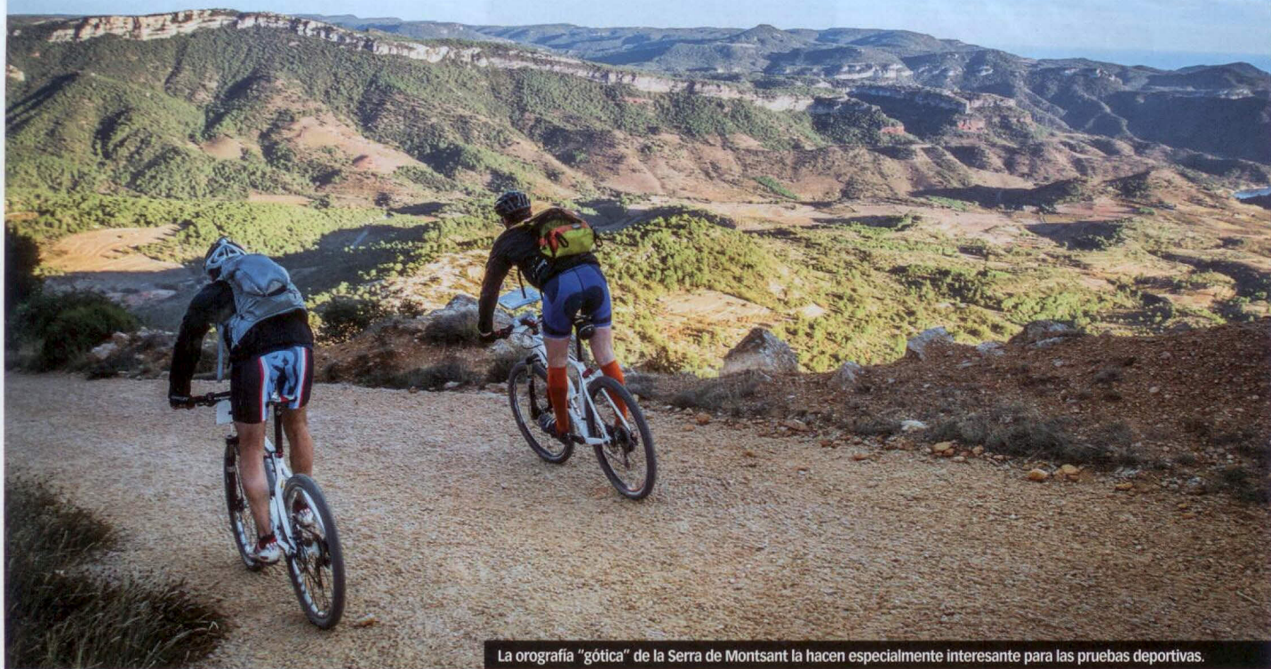
La orografía "gótica" de la Serra de Montsant la hacen especialmente interesante para las pruebas deportivas.