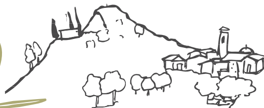
Poble de Marçà, a redós de la Miloquera.

Justo antes de llegar al pueblo de Marçà bordearemos el Mas d'en Crusat, una de las masías más antiguas y notables del pueblo, y que cuenta con una capilla propia dedicada a Sant Marià. En la actualidad se cultivan los campos de su alrededor, formados sobre todo por viñedos, avellanos y almendros.