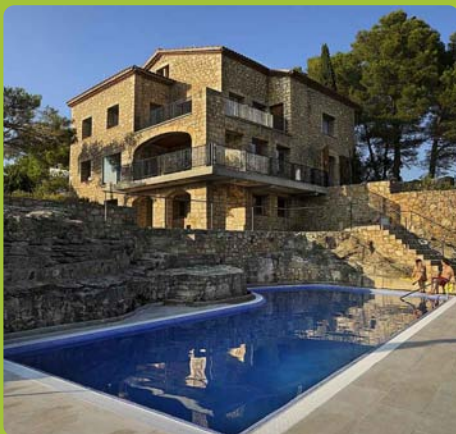
Mirador de Siurana. Hôtel El Carcaix. Restaurant Gastronomie, paysage, accueil et confort

Après la chute de Tortosa et Miravet, Siurana continuait à résister. Les rochers de la Gritella et son important château coupaient le passage et faisait de ce lieu un endroit presque infranchissable. Malgré tout, le futur de Siurana était décidé. La légende raconte que juste avant la défaite, la fille du vali (gouverneur) de Siurana, la belle Abdelazia, plutôt que de se voir captive des chrétiens, apparut sur un superbe cheval blanc et se dirigea très rapidement vers la falaise au pied du mur du château. C'est là que l'animal fit un saut impressionnant et ensemble ils disparurent mortellement dans le vide. Les incroyables trouvèrent la marque du fer du cheval de la reine dans la roche, comme preuve du dernier élan du corsaire pour emmener Abdelazia vers l'immortalité.