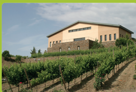
Celler Buil&Giné Hochklassige Weine seit 1997