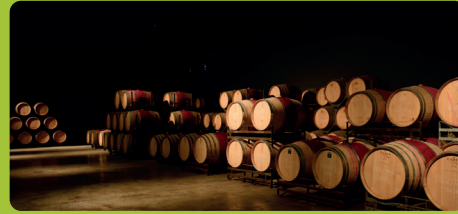
Torres Priorat. DOQ Priorat